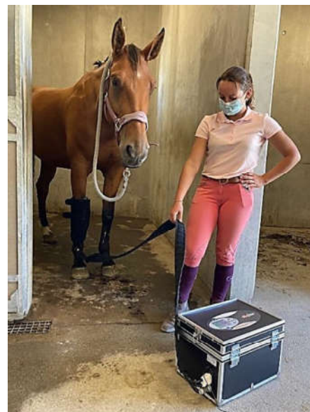
Photo : mise en place du traitement