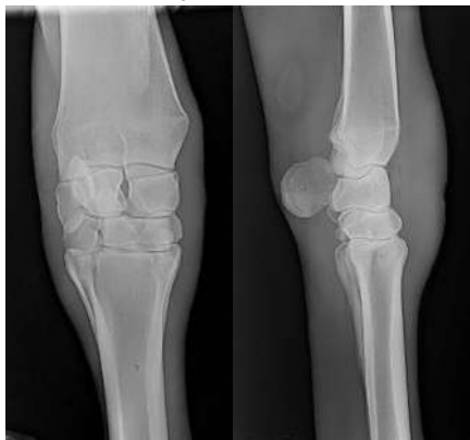
Photo : radiographies de face et de profil du genou droit - œdème marqué et absence de lésion ostéo-articulaire mis à part une discrète arthropathie carpo-métacarpienne