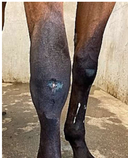
Photo : genou avant la cryothérapie compressive avec un œdème marqué